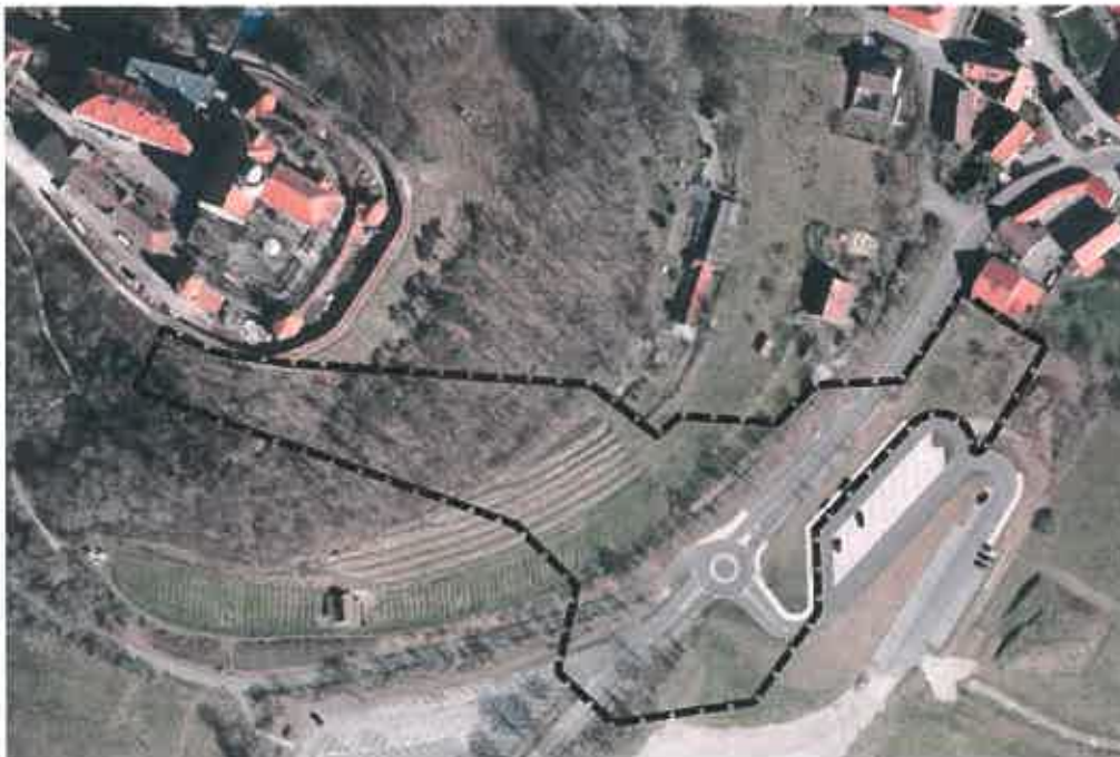
Übersichtsskizze zur Lage des Planbereiches (unmaßstäblich)

Der vorläufige Geltungsbereich des Vorhabenbezogenen Bebauungsplans ist in der Übersichtsskizze dargestellt. Die Größe des Planbereiches von ca. 1,2 ha umfasst die Möglichkeit der Umsetzung von 2 Varianten des Verlaufs des Schrägaufzuges. Mit der Erarbeitung des Entwurfs des Bebauungsplans gem. § 3 Abs.2 BauGB wird der Geltungsbereich entsprechend der dann umsetzungsfähigen Variante konkretisiert und angepasst.