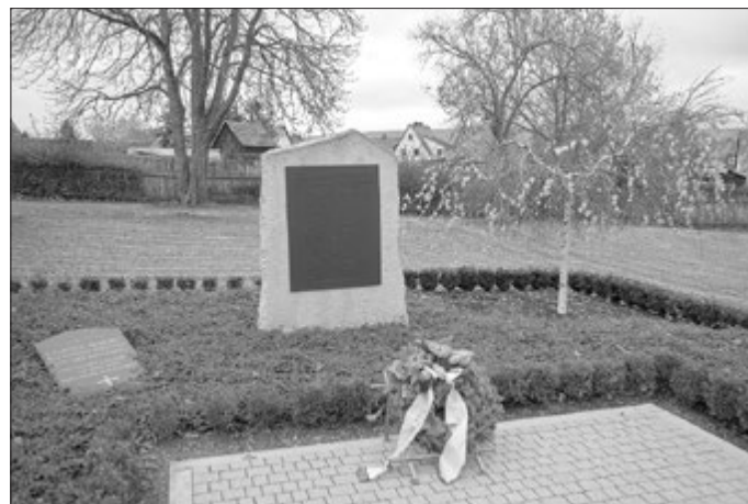
Friedhof Großkamsdorf, hier wurden 36 Zwangsarbeiter aus Werk E beerdigt.

Das Bauvorhaben Großkamsdorf wurde trotz Produktionsbeginn weiterhin von Kompetenzstreitigkeiten und Differenzen zwischen der Betriebsdirektion und der O.T. überschattet. Da beide unabhängig voneinander Entscheidungen trafen, die nachfolgend zu ständigen Auseinandersetzungen führten und oftmals in offene Feindschaft ausarteten. Die Situation eskalierte derartig, dass sogar der Staatsanwalt eingeschaltet werden musste.