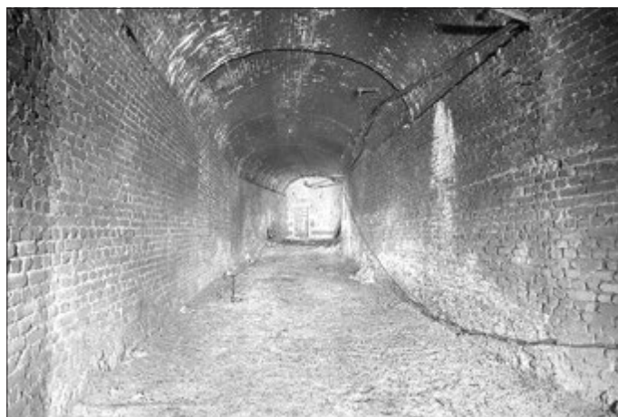
Hermann-Göring Stollen in Kamsdorf

Erst Ende 1944 wurden in die, zu diesem Zeitpunkt fertiggestellten unterirdischen Räumen Produktionsmaschinen angeliefert und aufgestellt. Fertiggestellt war auch der erste Bauabschnitt vom Hermann-Göring Stollen, betreffend den Bereich vom Mundloch in die Reviere Ernstschacht und Ersatzschacht.