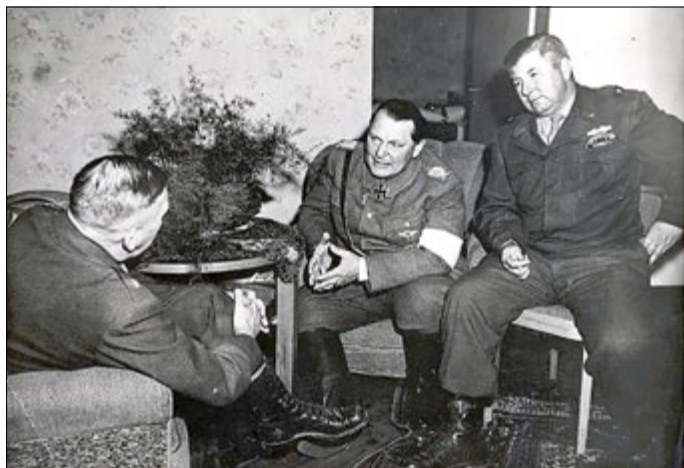
Göring im Hauptquartier der 36. Infanteriedivision in Kitzbühel

schiedenen, in Mauterndorf zu bleiben – Koller jedoch nicht darüber informiert! Daraufhin nahm Koller Verbindung mit Göring in Burg Mauterndorf auf und bat ihn mit seiner Familie sofort nach Fischhorn aufzubrechen. Da alle Straßen von Menschen und Truppenteilen verstopft waren, kam Göring nicht voran. Vom amerikanischen General Stack vermisst, entsandte dieser einige Offiziere, um Göring zu finden, was ihnen letztendlich auch gelang. Göring und seine Familie wurden zum Schloss eskortiert und Göring hoffte, sich dort nun endlich mit Eisenhower treffen zu können. Er ließ seine Familie im Schloss zurück und begab sich zum Hauptquartier der 36. Infanteriedivision in Kitzbühel. Hier traf er sich auch mit Vertretern der alliierten Presse, die ihn umfassend interviewten.